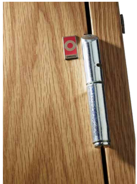
På det större dörrbladet finns fasade gångjärn i överkant, vilket minskar risken för patientskador. Övrig beslagning anpassas efter behov och kan styras elektroniskt eller manuellt.