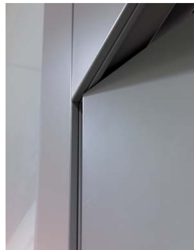
Med begreppet dold karm menas en inåtgående dörr som utan foder livar med väggen så att ytan blir slät.

I nära samarbete med arkitekter och inredare hittar Orresta Dörr unika uttryck, utan att fördyra projekten till det orimliga.