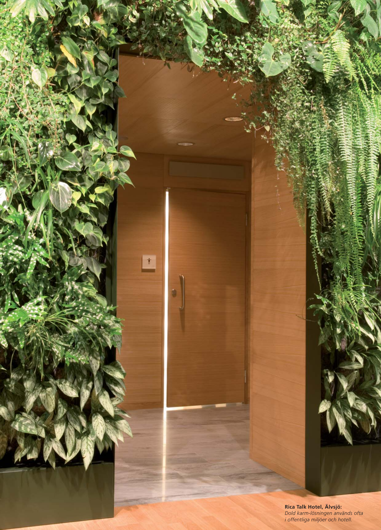
Rica Talk Hotel, Älvsjö: Dold karm-lösningen används ofta i offentliga miljöer och hotell.