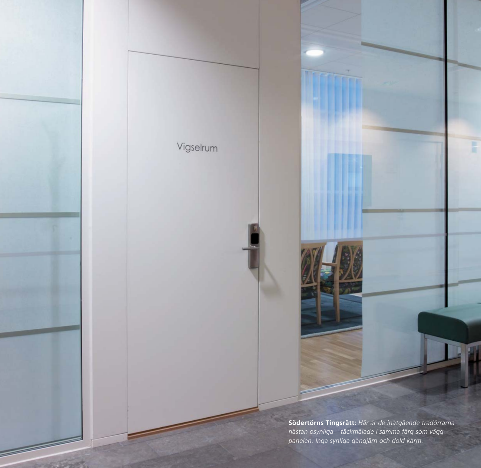
Södertörns Tingsrätt: Här är de inåtgående trädörrarna nästan osynliga – täckmålade i samma färg som väggpanelen. Inga synliga gångjärn och dold karm.