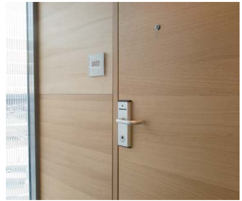
Rica Talk Hotel, Älvsjö: Liggande ekfaner på både panel och dörrar. Inåtgående dörrar med dolda gångjärn; utåtgående handikappdörrar med synliga gångjärn.