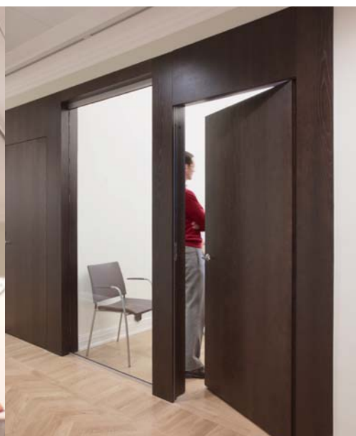
Kairos Future: Ultramoderna dörrar i betsad ek som kontrast till äldre detaljer från förra sekelskiftet. Inåtgående dörrar som en del i ett kraftigt väggparti. Inga synliga gångjärn och dold karm.