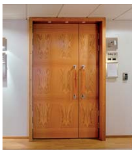
EKSLUSIVA FANERADE TRÄDÖRRAR

Orresta är specialiserat på exklusivt fanerade trädörrar och glasparterier i trä. Orresta är en medelstor dörrtillverkare med hög flexibilitet. Vilket ger arkitekter och inredare möjlighet att gå vid sidan av standardlösningar på ett kostnadseffektivt sätt samtidigt som man får brand- och ljudklassade produkter.